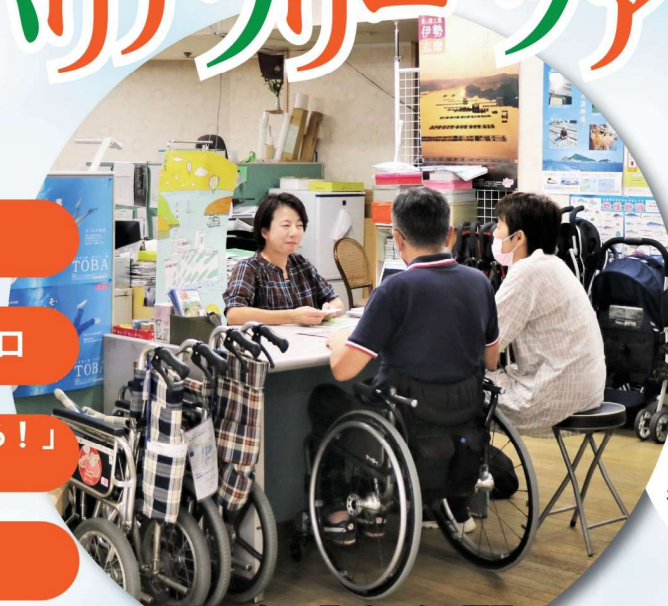
2002年4月 センター開設